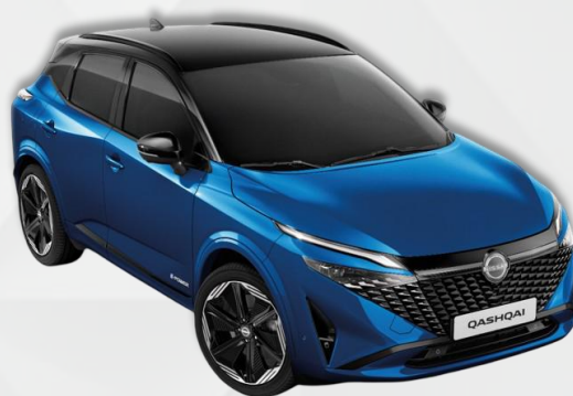
MAGNETIK PLAVA / CRNI KROV (XGZ)