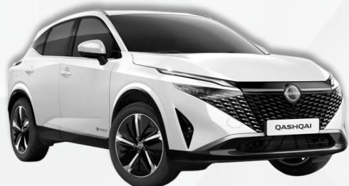
PERLA BELA (QBE)