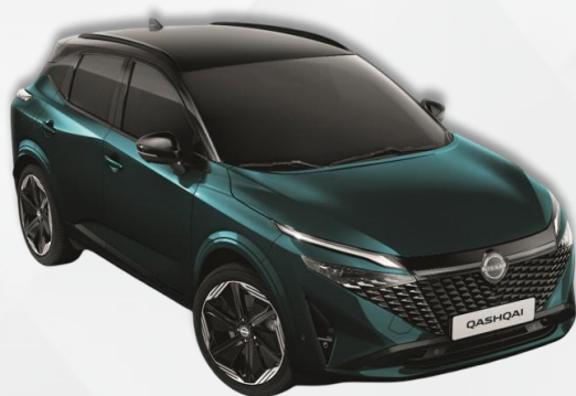
OCEAN DEEP / CRNI KROV (YBJ)