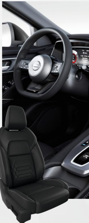
N-Design Alcantara kožna sedišta sa parcijalnim detaljima EKO kože (Z)