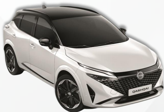
PERLA BELA / CRNI KROV (XKJ)