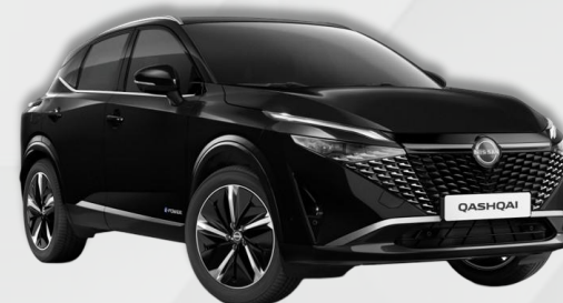
PERLA CRNA (GAT)