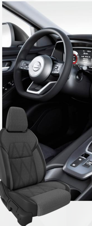
N-Connecta Sedišta u kombinaciji crne EKO kože i tkanine (G)