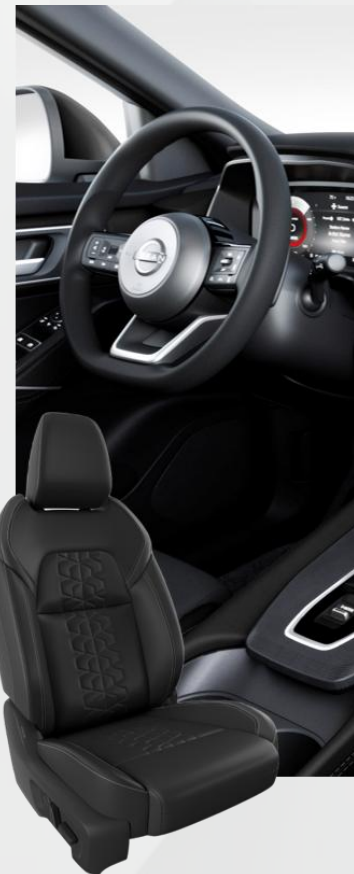
Tekna 1. Sedišta u kombinaciji crne i smeđe EKO kože (H) 2. Sedišta od crne EKO kože (G)