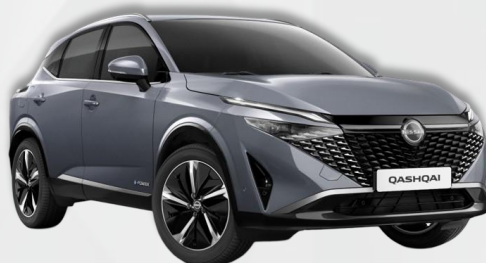
PERLA KERAMIK SIVA (KBY)