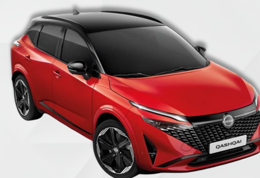
CRVENA / CRNI KROV (YAU)