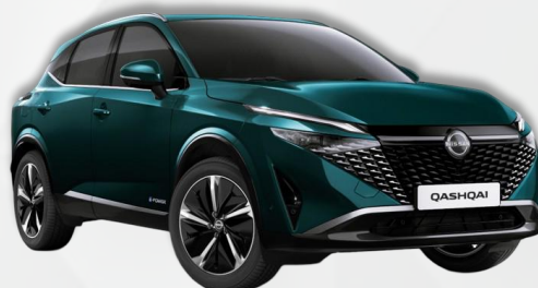
OCEAN DEEP (FAP)