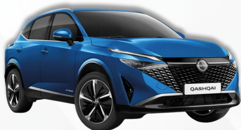
MAGNETIK PLAVA (RCF)