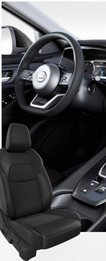
Acenta Sedišta od crne tkanine (G)