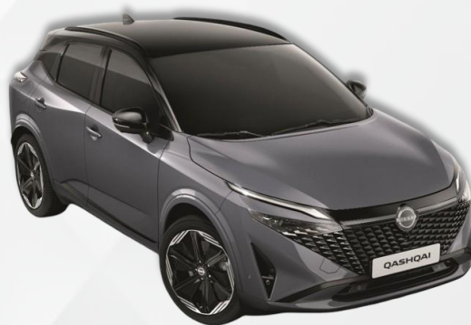
PERLA KERAMIK SIVA / CRNI KROV (XEX)