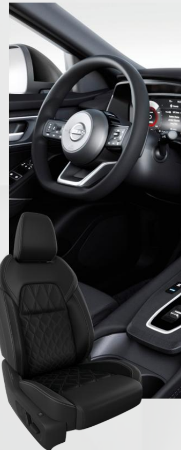
Tekna Plus Premium sedišta od crne kože sa parcijalnim Alcantara detaljima (Z)